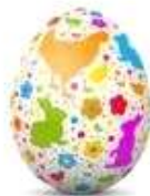
Illustration: Fabrice Sif

Un œuf peint est posé Sur la paille d'un panier. C'est un poussin ? C'est un pantin ? Un serpent ? Non, C'est un œuf de Pâques peint !